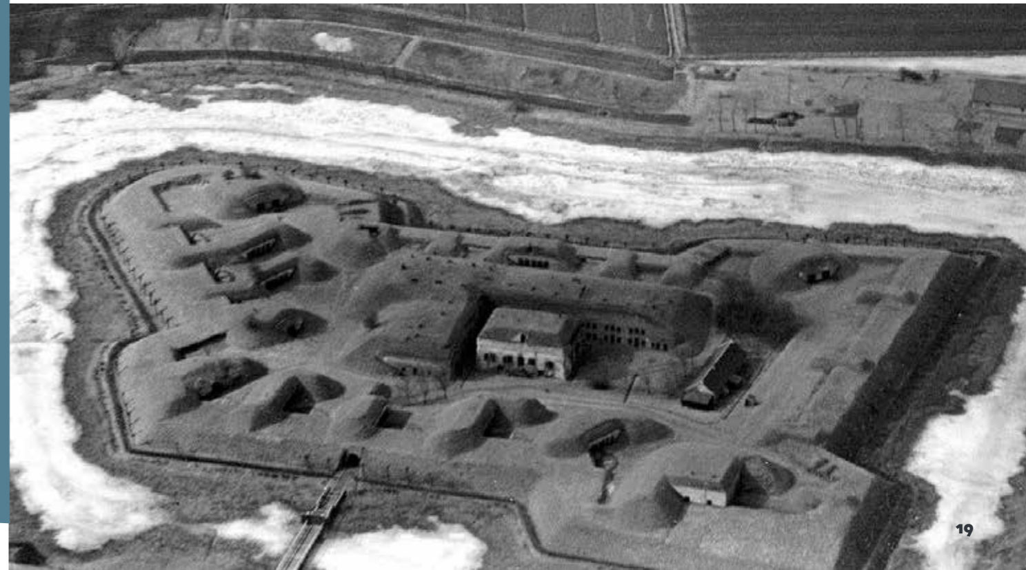
Het fort in oude glorie. De grondlichamen zijn duidelijk zichtbaar.

In de toekomst volgt de herbestemming van de binnenkant van de geschutstoren, de kazerne en het kruithuis. Dit zal gebeuren in samenspraak met de exploitant van het fort. Op dit moment loopt het traject om te komen tot een juiste, passende exploitatie die naar verwachting eind dit jaar bekend is. Meer informatie hierover staat in de eerder dit jaar verschenen Erfgoedpecial Ooltgensplaat. Deze is verkrijgbaar bij onder andere het VVV Inspiratiecentrum in Ouddorp.