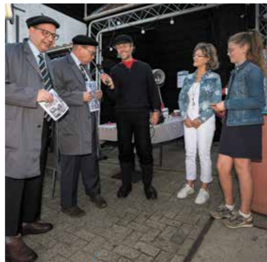
Het publieksevenement vond in 2019 plaats op de Menheerse werf.

media in de gaten! Een groepje havo 3-leerlingen van de CSG Prins Maurits is druk bezig met het programma en het promoten van het event, vooral voor de kinderen tot 12 jaar en jongeren van 12 tot 18 jaar.