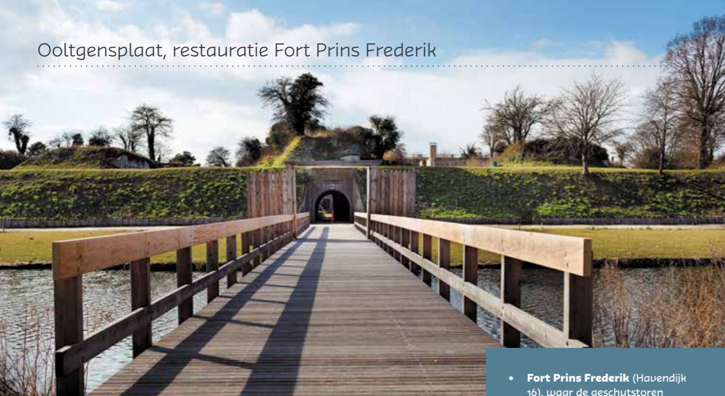
Fort Prins Frederik met gereconstrueerde toegangsbrug.